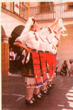
Bulharský folklorní soubor Pirin

Připravena je také řada doprovodných akcí. V průchodu mezi Velkým Špalíčkem a Šilingrovým náměstím ochutnají